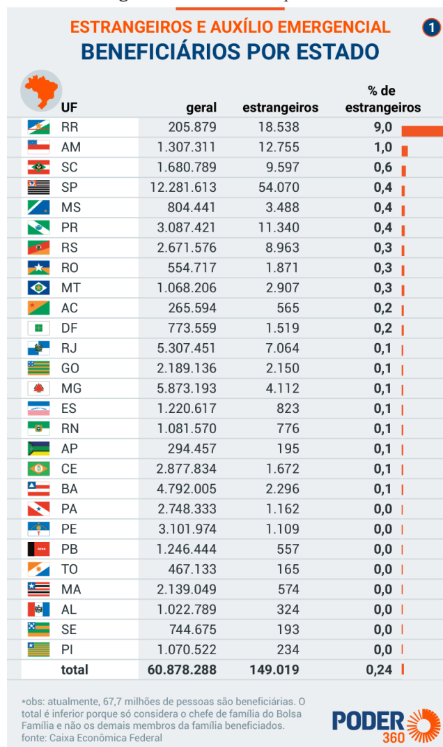
Figura 1 – Beneficiários por estado