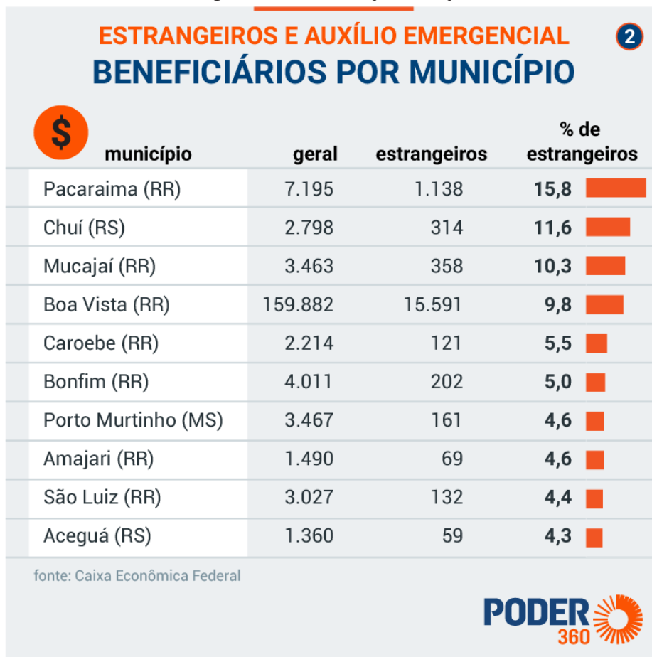
Figura 2 – Beneficiários por município